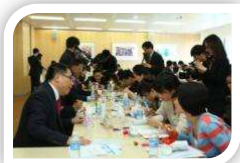
东亚中国和上海宋庆龄基金会的领导与记者一同在爱心套杯上作画，该套杯将经由志愿者传递至汶川二小的孩子们的手中